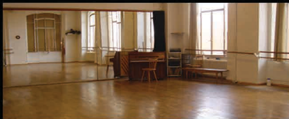
Studio Kniaseff - Rue Caroline 7, 1003 Lausanne