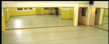
Studio Misha - Rue Caroline 7, 1003 Lausanne