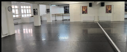
Studio Bédart - Rue Centrale 31, 1003 Lausanne

Renseignements : Tél. : 021/311.11.05 E-Mail : contact@igokat.com